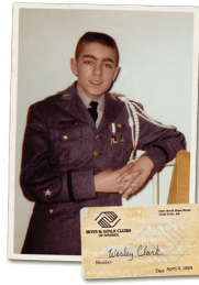
General Wesley Clark